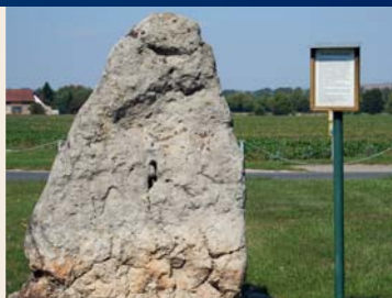
Hünstein bei Nohra