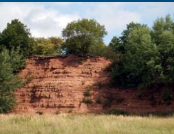
Aufschluss bei Kehmstedt

An der Landstraße von Bleicherode nach Kehmstedt sehen wir auf der linken Seite vor einer steilen Kurve eine rotbraune Sandsteinwand. Es ist ein ehemaliger Sandsteinbruch. Früher wurde er zur Sandgewinnung für Bauzwecke genutzt. Die rotbraunen Sandsteine zeigen eine fein- bis mittelkörnige, z. T. auch grobkörnige Ausbildung und sind bindemittelarm. Aufgrund dieser Eigenschaften sind sie besonders gut für Bauzwecke geeignet. Geologisch gehören sie dem Mittleren Buntsandstein an. Bis Mitte der 1990er Jahre wurden im früheren Sandsteinbruch unerlaubt Bau- und Siedlungsabfälle abgelagert. Diese wilde Müllkippe wurde später unter staatlicher Aufsicht beräumt, der Müll fachgerecht entsorgt. Heute ist der Buntsandsteinaufschluss bei Kehmstedt als Flächen-naturdenkmal geschützt.