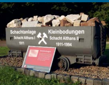
Ort des Gedenkens

Die versteckt liegenden Schächte wurden zwischen 1909 und 1913 abgeteuft. Anfang der 1930er Jahre erfolgte ihre Stilllegung wegen fehlenden Absatzes. Schon ein Jahr nach der Machtergreifung ließen die Nationalsozialisten ein Munitionsdepot einrichten. Im Gegensatz zu anderen unterirdischen Munitionsanstalten (z. B. Kalischacht Ludwigshall) fand hier jedoch keine Produktion statt. Ab Juni 1944 erfolgte die Räumung der oberirdischen Lagergebäude der Heeres-Nebenmunitionsanstalt um dort das Außenlager „Emmi“ des KZ Mittelbau einzurichten. Die Häftlinge mussten beschädigte V2-Raketen in ihre Einzelteile zerlegen. Am 5. April 1945 wurden sie auf den Todesmarsch zum KZ Bergen-Belsen geschickt. Die Kaliförderung wurde nach dem Krieg wieder aufgenommen. Zu DDR-Zeiten befand sich hier der Materialschacht der Grube Bleicherode. Beide Gruben waren seit 1953 verbunden.