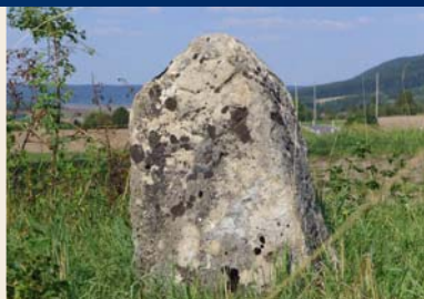
Grenzstein bei Rehungen