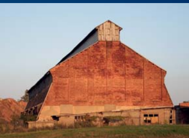
Industrieruine Kalischacht Ludwigshall

Der Kalischacht Ludwigshall südöstlich von Wolkramshausen wurde 1905 bis 1907 geteuft. 1911 erfolgte die untertägige Verbindung mit der Grube Immenrode. Mit einer Seilbahn wurde das geförderte Salz zur Verarbeitung nach Ludwigshall gebracht. Die bereits 1914-16 einmal unterbrochene Förderung wurde 1924 endgültig eingestellt. 1936 übernahm dann eine Heeres-Munitionsanstalt die Schächte, ließ Granaten zusammensetzen und lagern. Auf der 660 m-Sohle in Ludwigshall ereignete sich am 29. Juli 1942 eine schwere Explosion, durch die 145 Arbeiter ihr Leben verloren. Das Munitionslager wurde danach aufgegeben. Ab 1954 wurde das Kaliwerk zurückgebaut. Der dabei im Schacht eingebaute Dichtpfropfen entsprach jedoch nicht dem Stand der Technik. Zum dauerhaften Verschluss erfolgte deshalb im Auftrag des Freistaates Thüringen 2012/13 die endgültige Verfüllung der Schachtröhre.