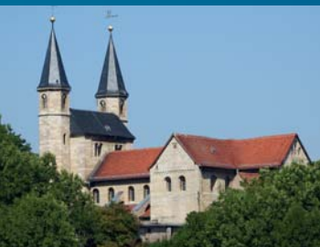
Basilika St. Gangolf

Im nördlichen Vorland der Hainleite thront auf einer kleinen Anhöhe eines der in der Geoparkregion gar nicht so seltenen, imposanten romanischen Bauwerke. Es ist die in den Jahren 1882 bis 1885 auf Anregung des preußischen Konservators der Denkmäler FERDINAND VON QUAST (1807-1877) wiedererrichtete und 1951 bis 1957 umfassend sanierte Basilika St. Gangolf Münchenlohra. Die Kirche war Teil des wohl von den Grafen von Lohra gegründeten Klosters, des 1477 in den Admonter Totenroteln nachgewiesenen Augustinerchorfrauenstifts. Im Bauernkrieg wurde das Stift in eine Domäne verwandelt, die ab 1815 dem preußischen Staat gehörte. Die Türme der Kirche waren da längst abgerissen, ebenso die Westapside, die Seitenschiffe und Nebenapsiden. Im verbliebenen Hauptschiff befand sich die Dorfkirche. Im verkarsteten Untergrund wurde Marienglas gefunden, ein Gipsmineral.