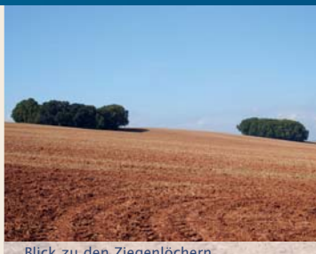
Blick zu den Ziegenlöchern