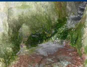
Sülzequelle bei Niedergebra

Etwa 250 m westlich vom Bahnhof Gebra (Hainleite) befindet sich auf der gegenüberliegenden Seite der Autobahn A 38 das Naturdenkmal Sülzequelle. Salzhaltiges Wasser wird in einem kleinen Teich aufgestaut. Die Quelle selbst liegt im Wald versteckt, ist aber zugänglich. Bedeutsam für die Wasserführung dieses Gebietes sind vorhandene geologische Störungszonen. Am Hang der Bleicheröder Berge finden sich Gesteine des Oberen Buntsandsteins (Röt), die stark ausgelaugt sind und salzhaltiges Grundwasser führen. Dieses kann sich in den verkarsteten Bereichen gut ausbreiten und in den darunterliegenden Mittleren Buntsandstein (Untertrias) infiltrieren. Verstärkt wird der Salzgehalt durch an der Kalirückstandshalde Sollstedt in den Buntsandstein versickernde Niederschlagswässer. Dem Verlauf der Gesteinsschichten folgend, suchen sich die salzhaltigen Wässer ihren Weg ans Tageslicht.